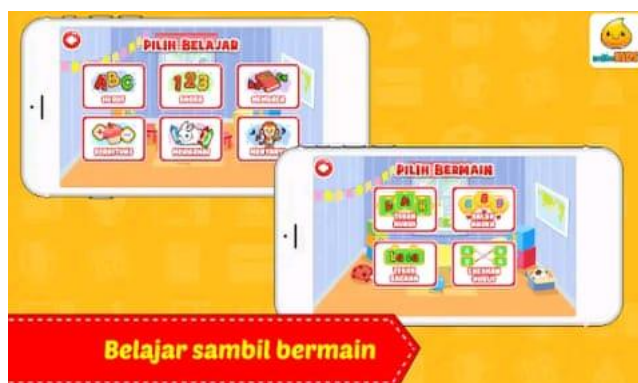
Gambar 1. Tampilan Aplikasi bagian pengenalan huruf, angka dan warna

Pada aplikasi berbasis android tersebut anak usia dini dapat belajar melalui smartphone dengan lebih menyenangkan karena terdapat game edukatif dan pengenalan angka, huruf buah, hewan, do'a sehari-hari yang terdapat audio atau suara. Terdapat banyak sekali pilihan materi pembelajaran yang lengkap untuk meningkatkan kognitif pada anak anak usia dini.