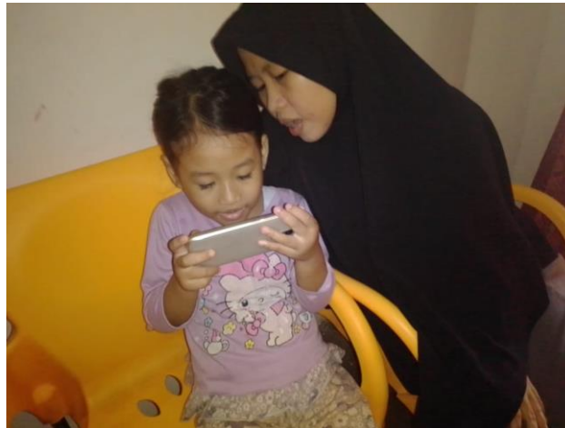
Gambar 7. Ibu sedang mendampingi anak bermain gadget

Dari Wawancara dan penelitian pada subjek 1 peran orangtua dalam era digital ini orangtua menetapkan batas waktu saat menggunakan teknologi untuk belajar ataupun menikmati hiburan. Orangtua juga membatasi aktivitas berinternet anak di rumah dengan menyimpan password dan memblokir konten yang berisi pornografi atau mengaktifkan program kids mode atau parental control di smartphonanya. Orangtua selalu berusaha mendampingi anak saat menggunakan gadget, memberikan penjelasan tentang apa yang sedang dipelajari. Pada saat anak tertarik pada hal atau konten yang menurut orangtuanya kurang sesuai, orangtuanya memberikan penjelasan kepada anak mengapa ini baik atau mengapa yang lainnya tidak baik. Dan orangtua menerapkan pembatasan waktu penggunaan Smartphone, yaitu hanya digunakan selama satu jam dengan membuat perjanjian kepada karena pada subjek 1 anak belum dapat mengerti mengenai jam jadi orangtua membuat kesepakatan dengan orangtua menunjuk angka pada jam lalu meminta pendapat anak. Ketika anak menyetujui kesempatan tersebut anak tidak akan menangis ketika jam yang sudah ditentukan habis. Di sini mengajarkan tanggung jawab kepada anak atas apa yang sudah disepakati.