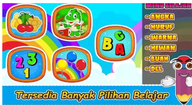
Gambar 2. Tampilan aplikasi berbasis android

Pada aplikasi berbasis android tersebut anak usia dini dapat belajar melalui smartphone dengan lebih menyenangkan karena terdapat game edukatif dan pengenalan angka, huruf buah, hewan, do'a sehari-hari yang terdapat audio atau suara. Terdapat banyak sekali pilihan materi pembelajaran yang lengkap untuk meningkatkan kognitif pada anak anak usia dini.