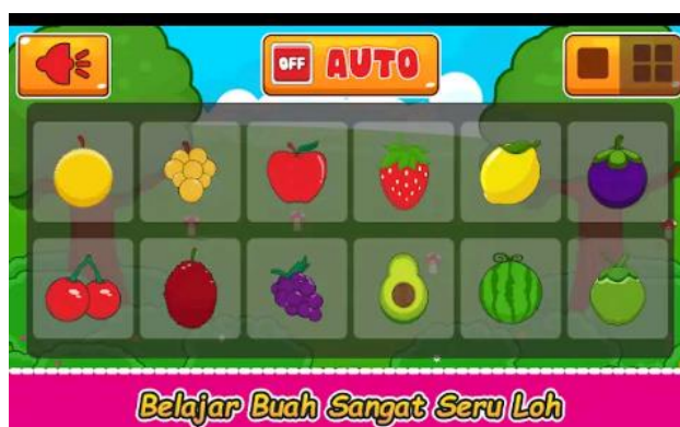
Gambar 5. Tampilan aplikasi pada pengenalan buah.

Pada pengenalan hewan tampilan aplikasinya sama dengan pada tampilan pengenalan huruf hanya saja pada tampilan hewan ini terdapat pengenalan suara-suara dari setiap hewannya sehingga anak dapat mengetahui nama-nama hewan beserta bunyinya seperti apa.