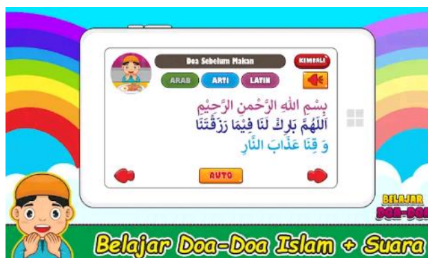
Gambar 6. Tampilan aplikasi pada bagian do'a sehari-hari

Pada aplikasi bagian tampilan pengenalan buah, pada tampilan aplikasi tersebut di desain dengan gambar yang jelas serta dilengkapi dengan audio suara ketika di tekan pada salah satu buah. Sama seperti tampilan-tampilan sebelumnya pada aplikasi game edukasi ini.