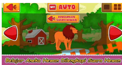
Gambar 4. Tampilan aplikasi pada bagian pengenalan hewan.

pengenalan huruf tersebut terdapat audio atau suara sehingga anak mengetahui bunyi atau pelafalan dari huruf A sampai Z.