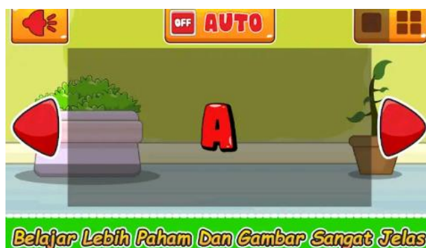
Gambar 3. Tampilan aplikasi bagian pengenalan huruf

Pada pengenalan huruf, angka dan warna pada aplikasi yang berbasis pada android tersebut tampilannya menarik dan dapat membuat anak senang untuk belajar mengenai angka, huruf dan warna pada aplikasi tersebut. Didalam aplikasi tersebut anak dapat memilih permainan apa yang ingin dimainkan dan anak juga dapat belajar dan mengetahui bentuk bentuknya.